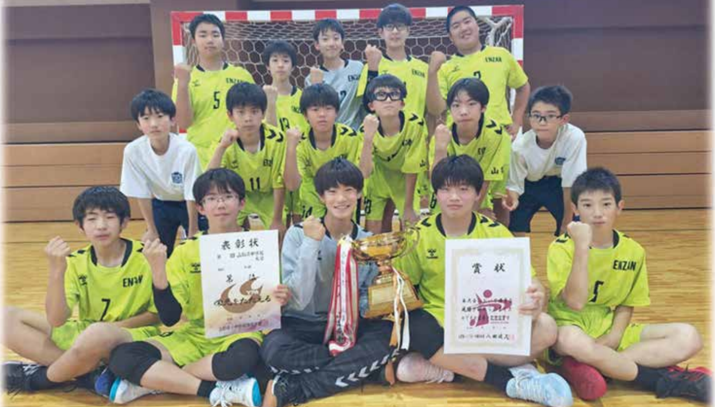
甲州市立塩山中学校 男子ハンドボール部保護者会