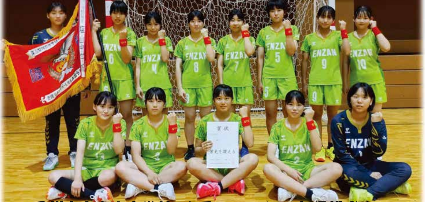
甲州市立塩山中学校 女子ハンドボール部保護者会

第31回関東社会人ハンドボール選手権大会 兼 第31回ジャパンオープンハンドボール トーナメント関東地区予選会 及び 第56回関東クラブハンドボール選手権大会